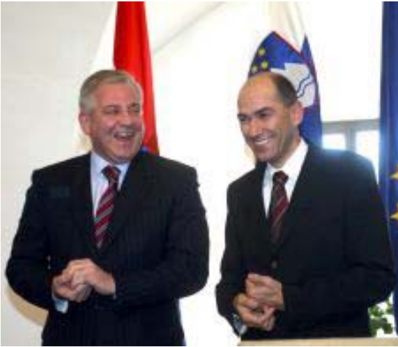
Ivo Sanader in Janez Janša

Slovenski in hrvaški premier, Janez Janša in Ivo Sanader, sta na današnjem prvem delovnem srečanju po oblikovanju nove slovenske vlade pregledala vsa odprta vprašanja med državama in se dogovorila o smereh njihovega reševanja. Kot sta povedala na skupni novinarski konferenci na gradu Mokrice, sta se dogovorila za oblikovanje sporazuma o preprečevanju incidentov v Piranskem zalivu, ki bi po besedah Sanaderja vključeval tudi rešitve začasnega ribolovnega režima. Dogovorila sta se tudi za skupno sejo obeh vlad v prvi polovici letošnjega leta, na kateri bi govorili tudi o odprtih vprašanjih, pripravili pa bi jo na Hrvaškem. Oba premiera sta menila, da je arbitražna o mejnem vprašanju ena od možnih metod iskanja rešitev, pred morebitno odločitvijo zanjo pa je po besedah Janše potrebno iskati dvostransko rešitev.